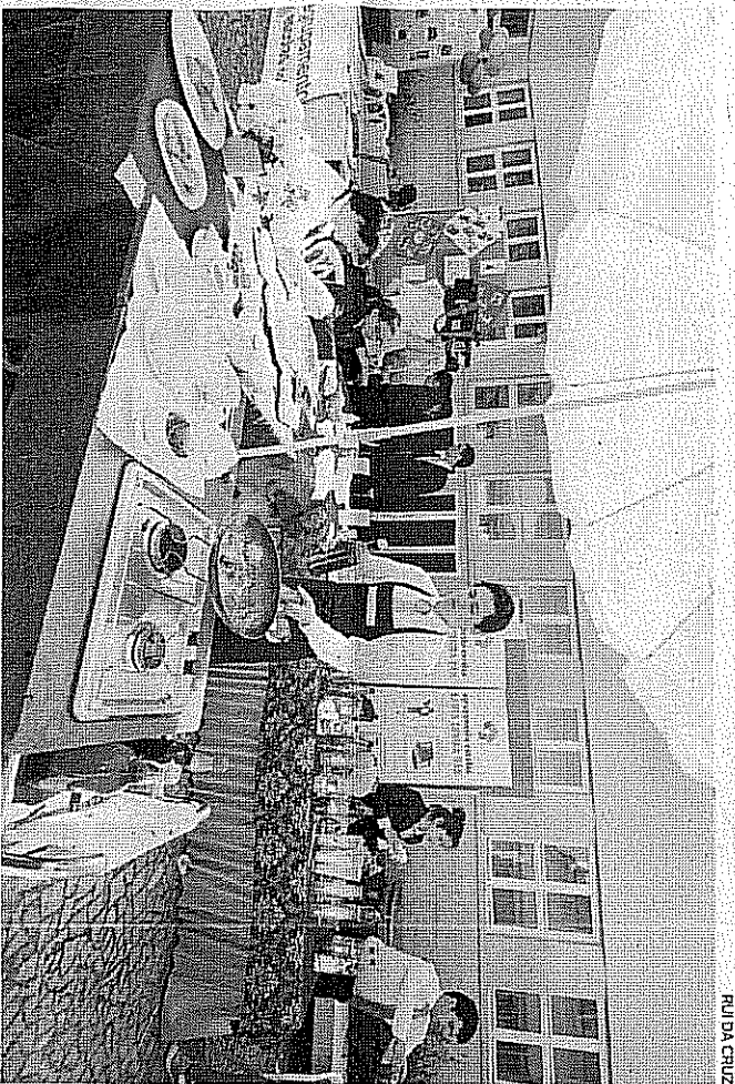
Alunos mostraram as suas apetiências para as questões empresariais