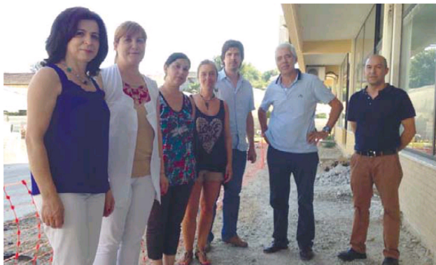
LOJISTAS //EM DEBANDADA