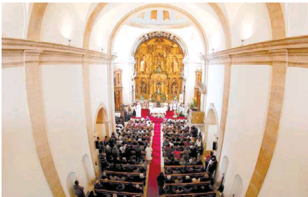
Igreja das Carmelitas é monumento nacional desde junho de 1910

AVEIRO Indefinição quanto à gestão e uso do templo na origem do problema