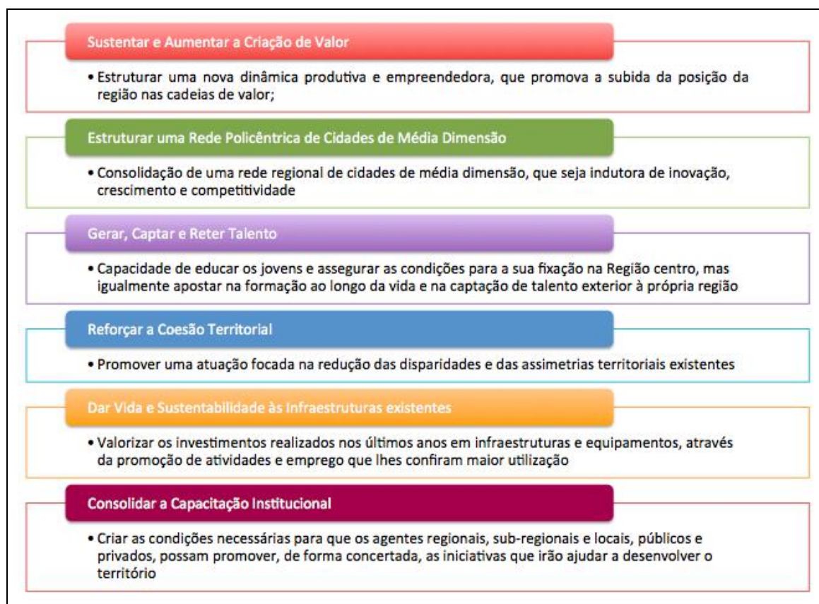
Fig. 2 - Prioridades Nucleares para a Região Centro 2020