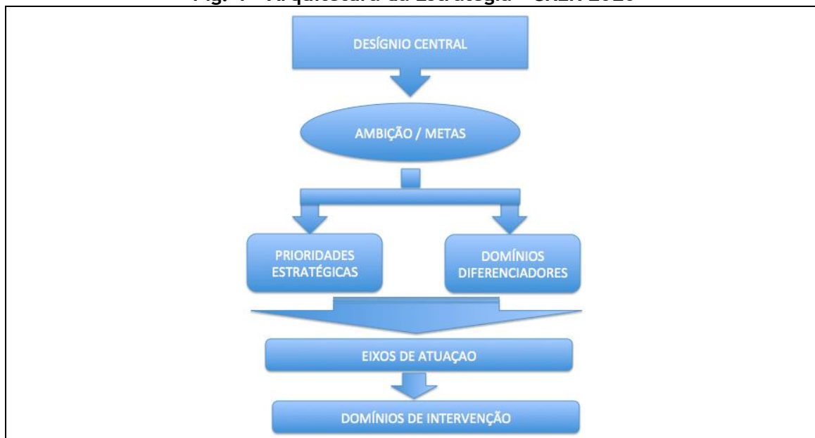
Fig. 1 - Arquitetura da Estratégia - CRER 2020